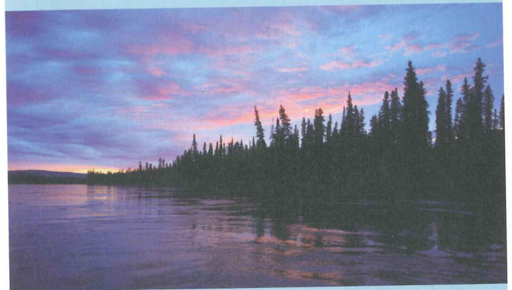
Les aventuriers de Solidream contemplant parfois des paysages à couper le souffle !

Ils sont arrivés à FAIRBANKS en ALASKA et filent jusqu'au-delà du Cercle Polaire Arctique.